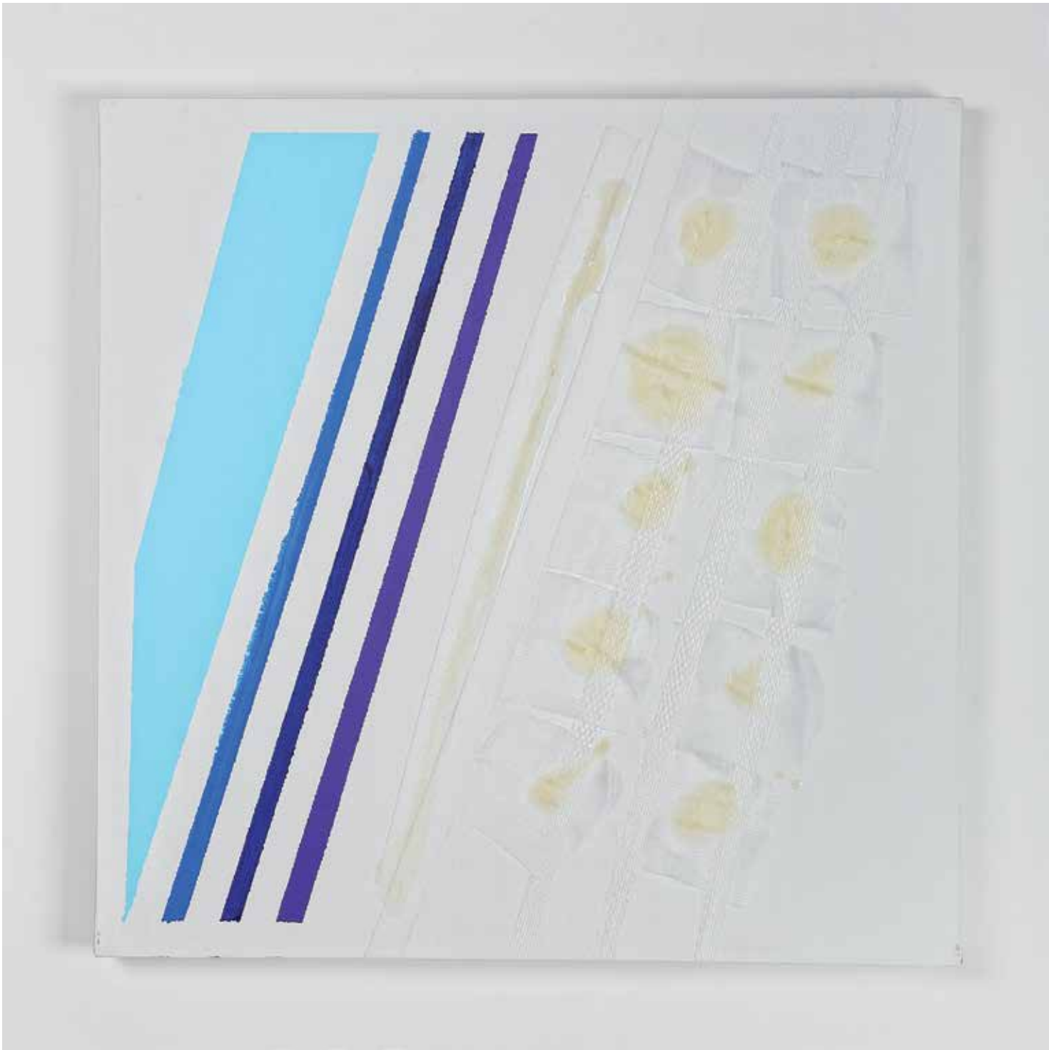
2011 - MEN SANA IN CORPORE SANO - 23" x 23" (cm 60 x 60) - mixed media technique on canvas