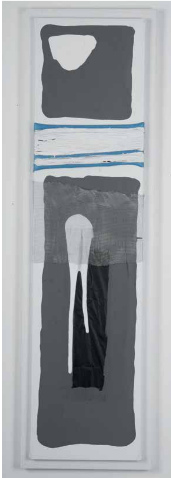
2009 - EMOTIONAL DIVERSION - 47" x 11" (cm 120 x 30) - mixed media technique on canvas