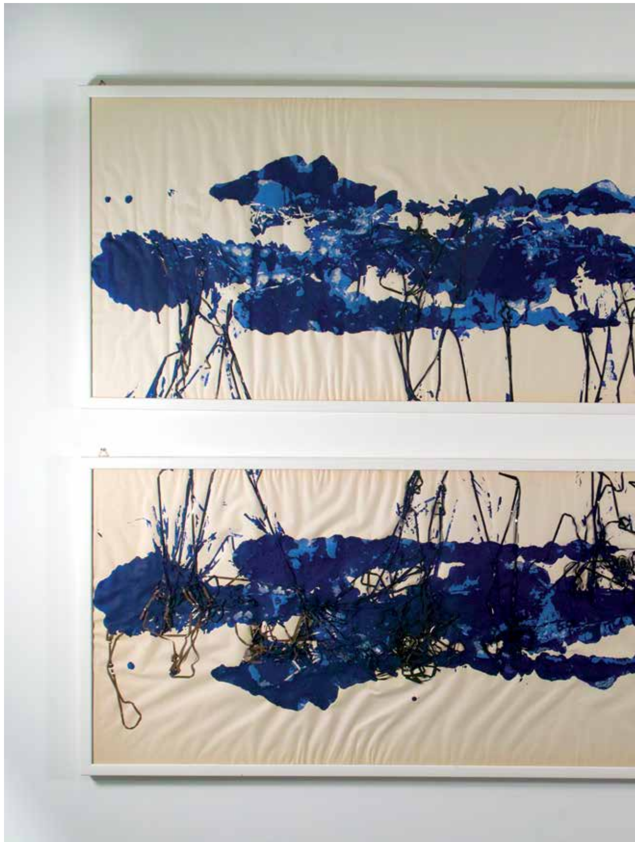
2013 - IDENTITÁ 1&2 - 73" x 22" (cm 185 x 55) - mixed media technique on wallpaper