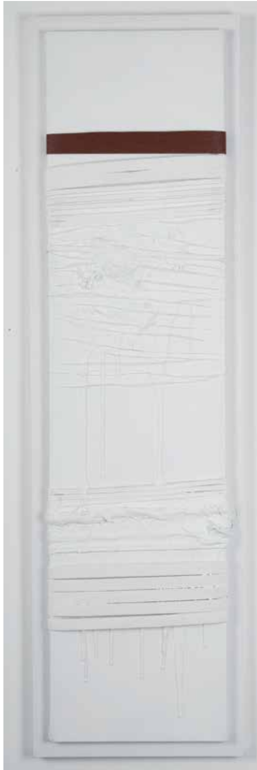
2009 - SYNTHETIC WHITE - 47" x 11" (cm 120 x 30) - mixed media technique on canvas