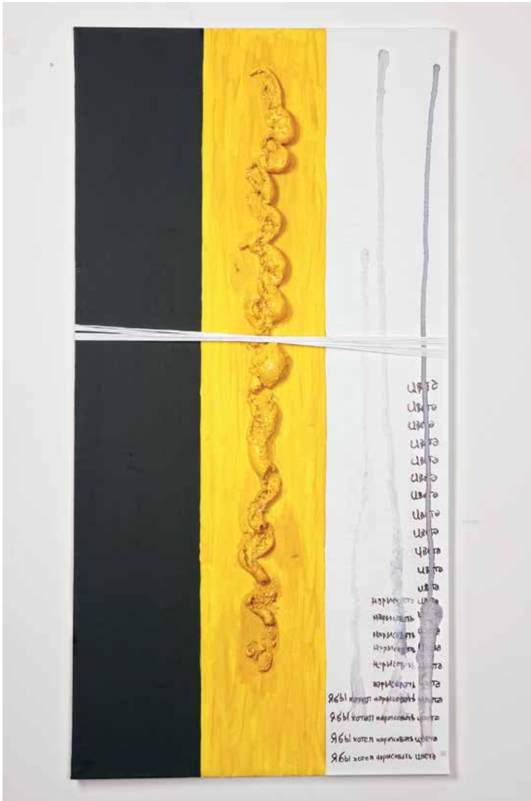
2011 - RUSSIA - 23" x 47" (cm 60 x 120) - mixed media technique on canvas