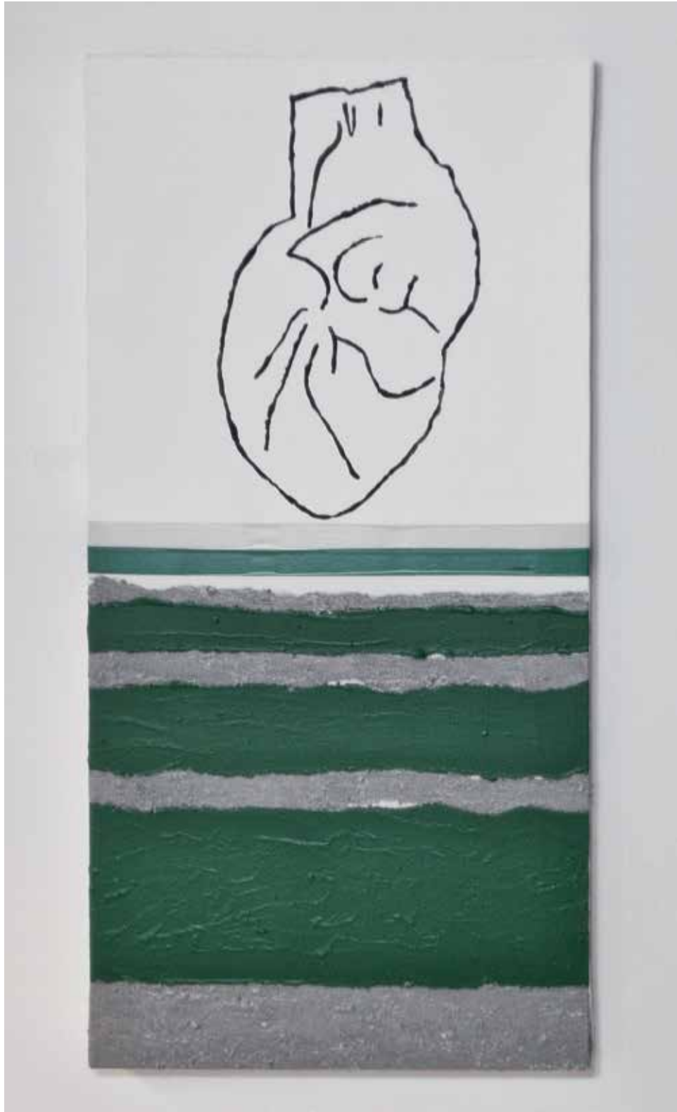
2013 - ANATOMICAL HEART #16 - 11" x 23" (cm 30 x 60) - mixed media technique on canvas