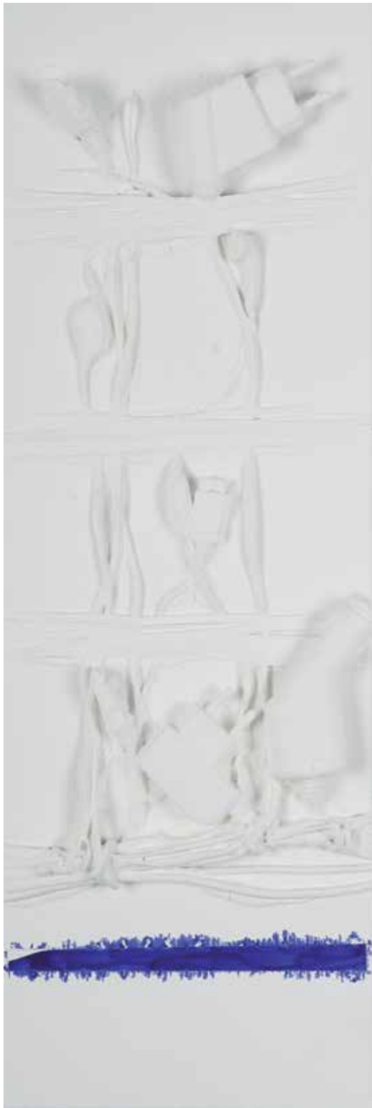
2010 - TOKYO - 8" x 23" (cm 20 x 60) - mixed media technique on canvas