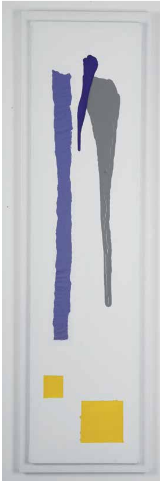
2009 - ITEMS OF BACKGROUND - 47" x 11" (cm 120 x 30) - mixed media technique on canvas