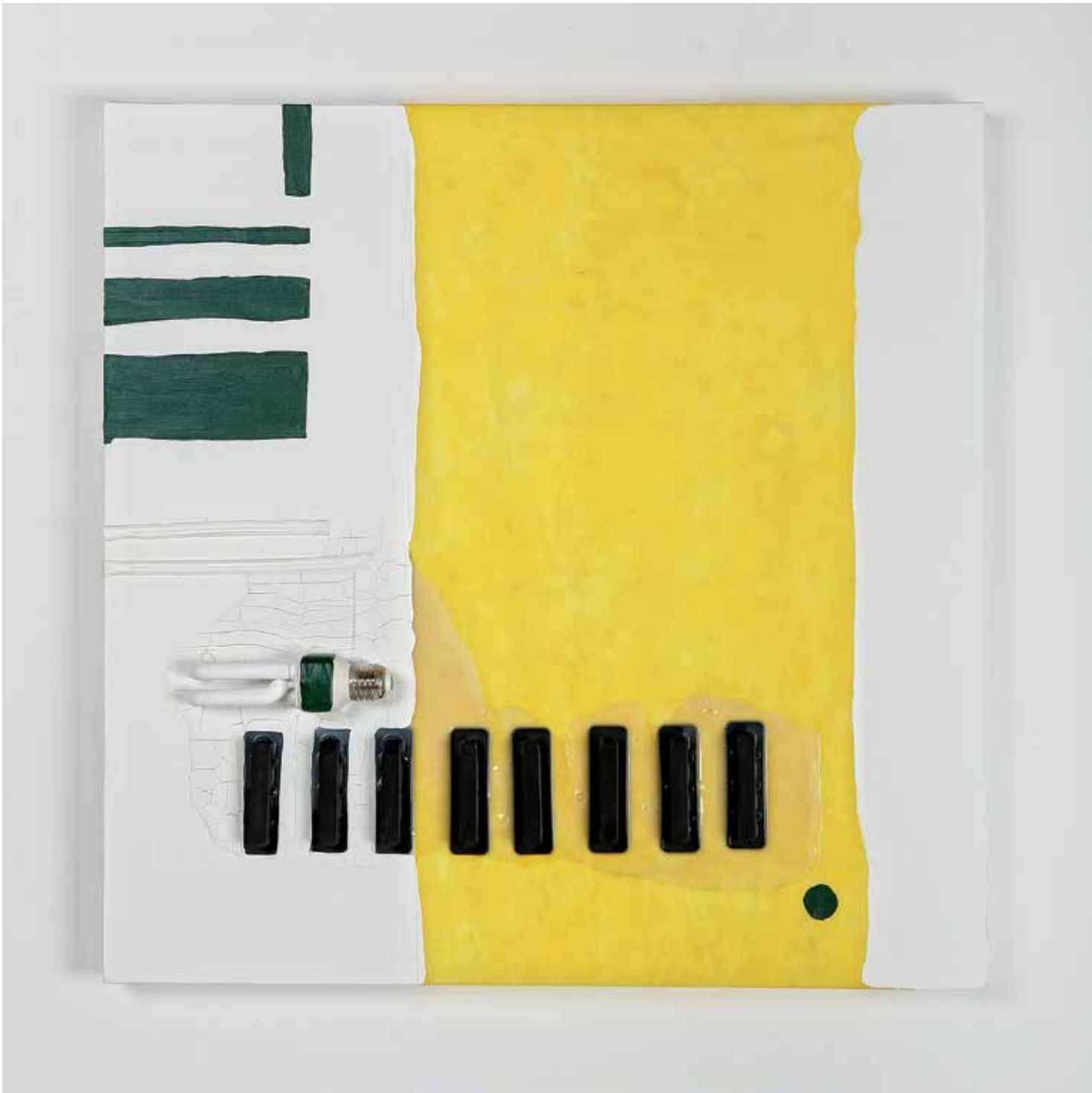
2011 - FUSIONE FREDDA - 23" x 23" (cm 60 x 60) - mixed media technique on canvas