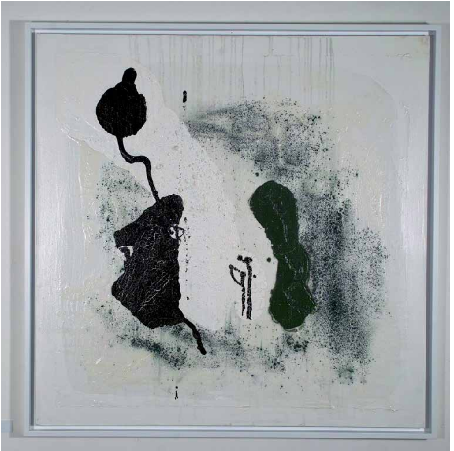
2014 - UNTITLED - 39" x 39" (cm 100 x 100) - mixed media technique on canvas