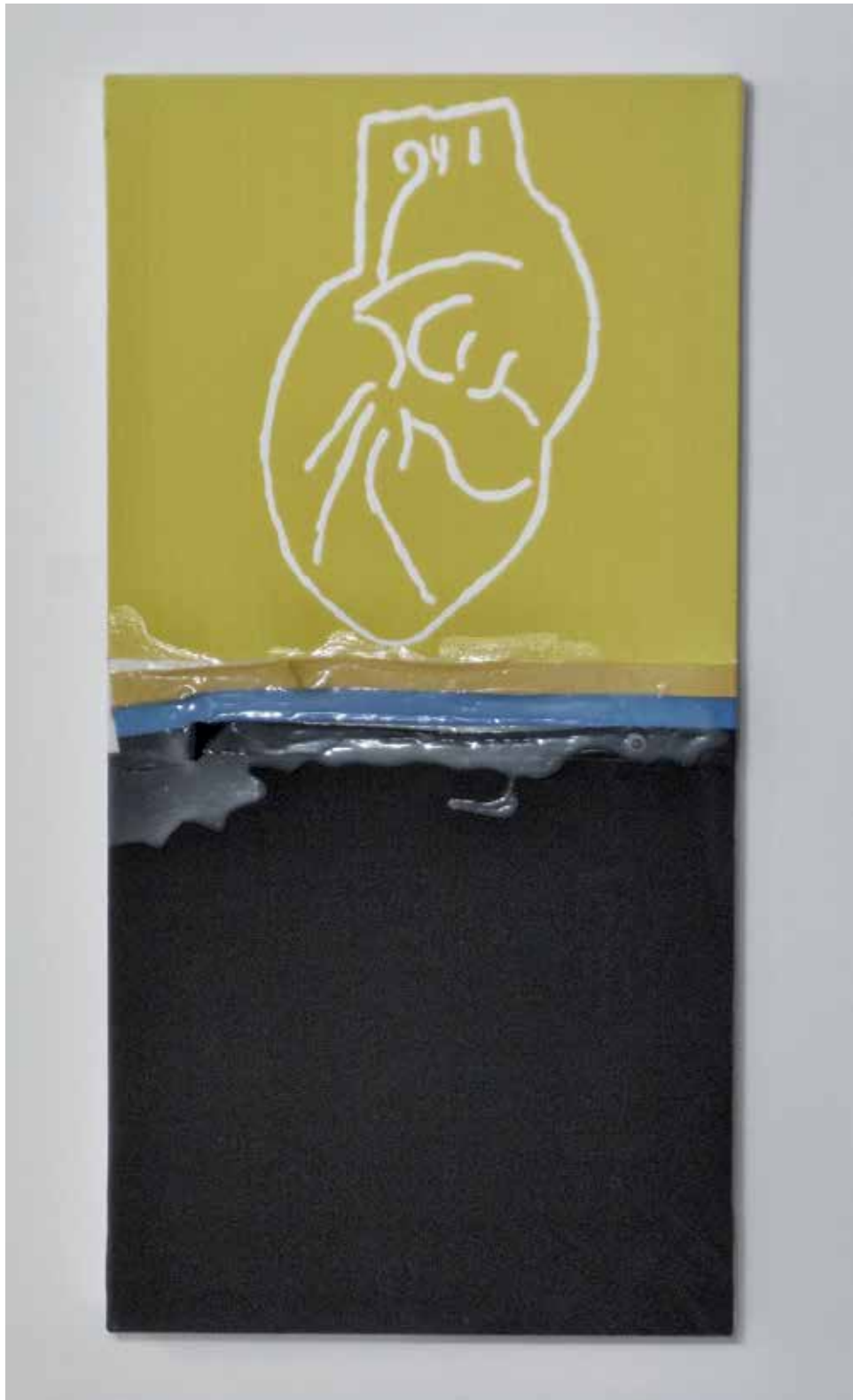
2013 - ANATOMICAL HEART #16 - 11" x 23" (cm 30 x 60) - mixed media technique on canvas