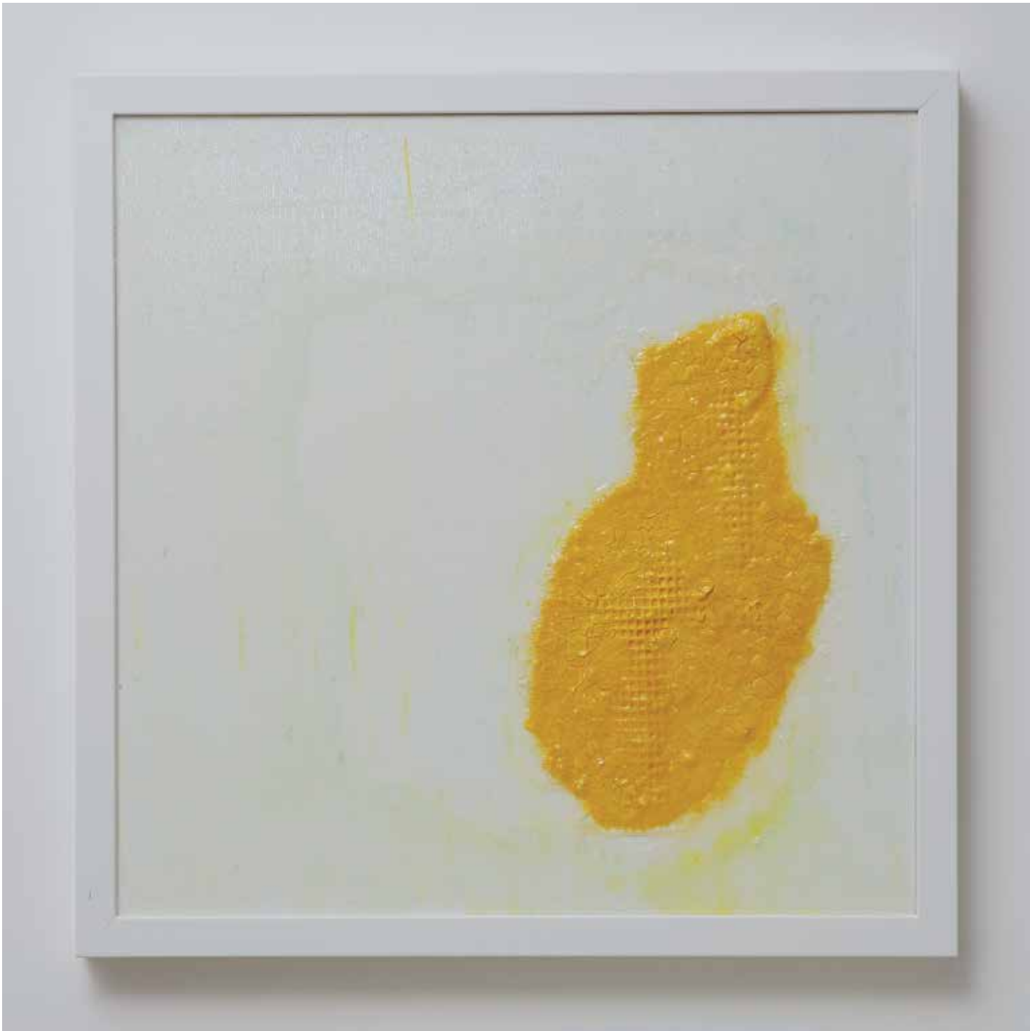
2013 - ANATOMICAL HEART #10 - 18" x 18" (cm 45 x 45) mixed media technique on canvas