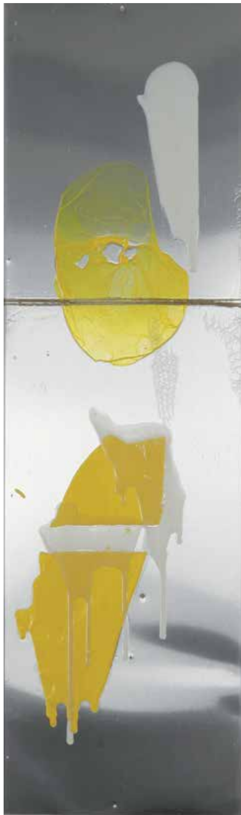
2009 - INTIMITÁ - 11" x 39" (cm 30 x 100) - mixed media technique on aluminium