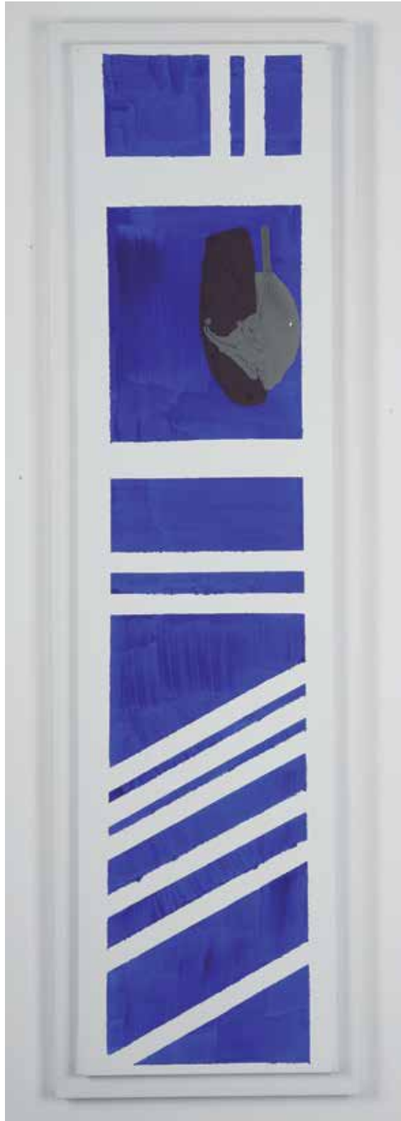
2009 - LEVELS OF TURMOIL - 47" x 11" (cm 120 x 30) - mixed media technique on canvas