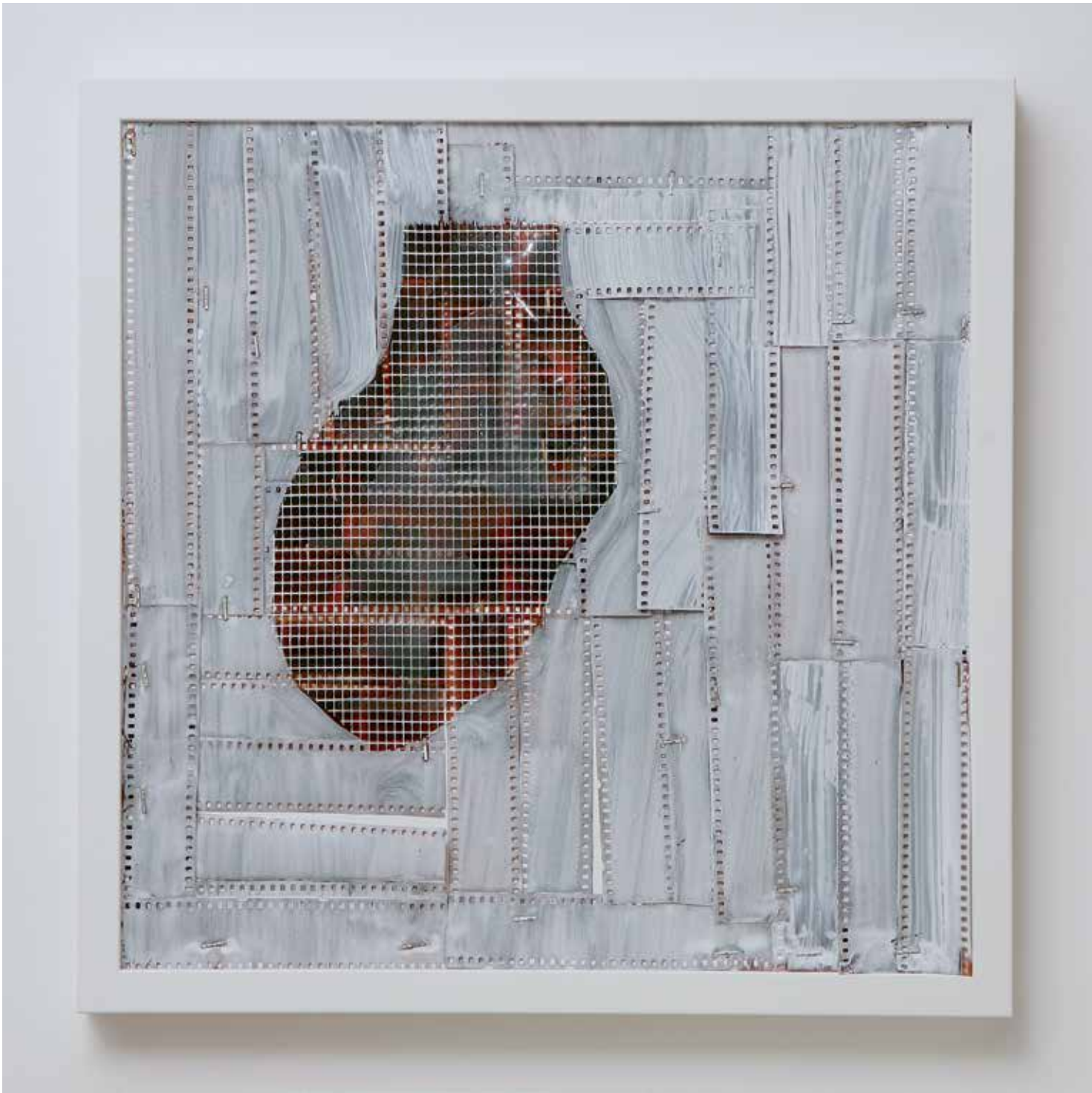
2013 - ANATOMICAL HEART #11 - 18" x 18" (cm 45 x 45) mixed media technique on canvas