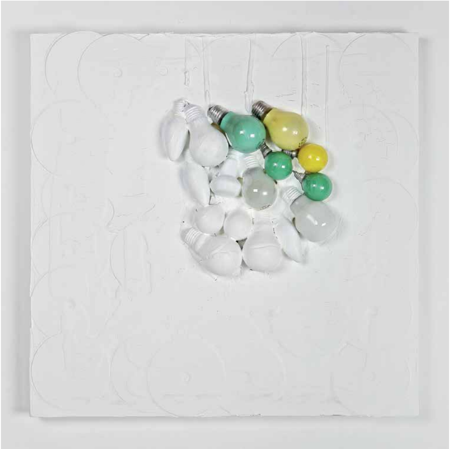
2011 - ILLUMINARIUM - 23" x 23" (cm 60 x 60) - mixed media technique on canvas