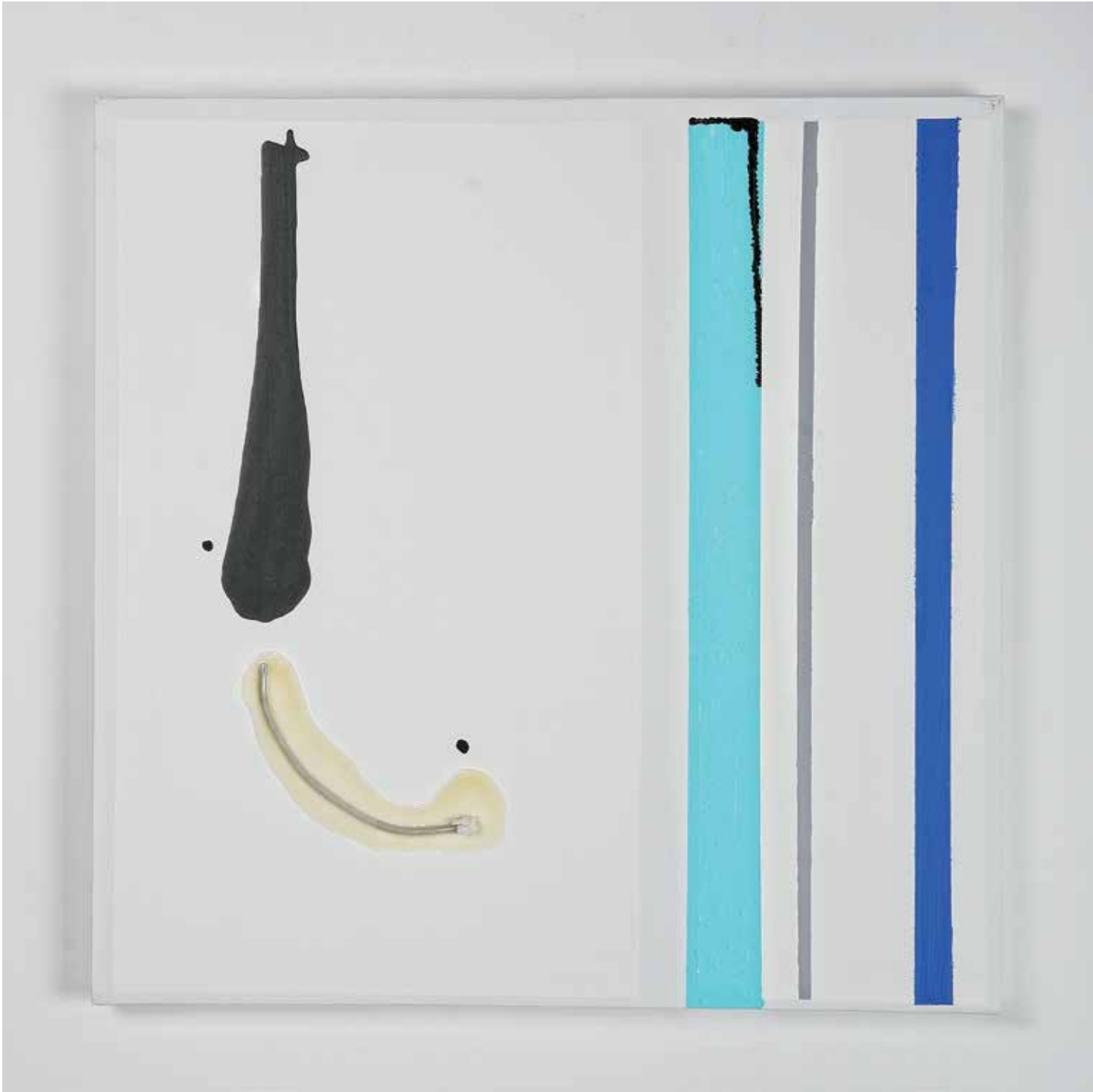
2011 - FRACTUS - 23" x 23" (cm 60 x 60) - mixed media technique on canvas