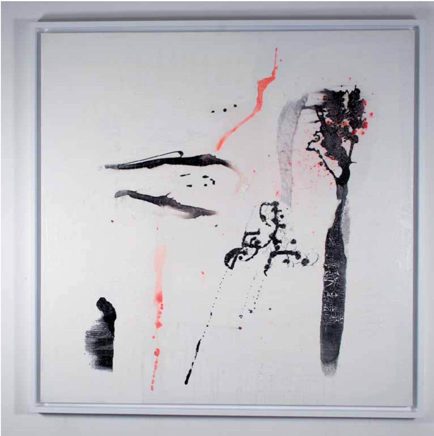
2014 - UNTITLED - 39" x 39" (cm 100 x 100) - mixed media technique on canvas