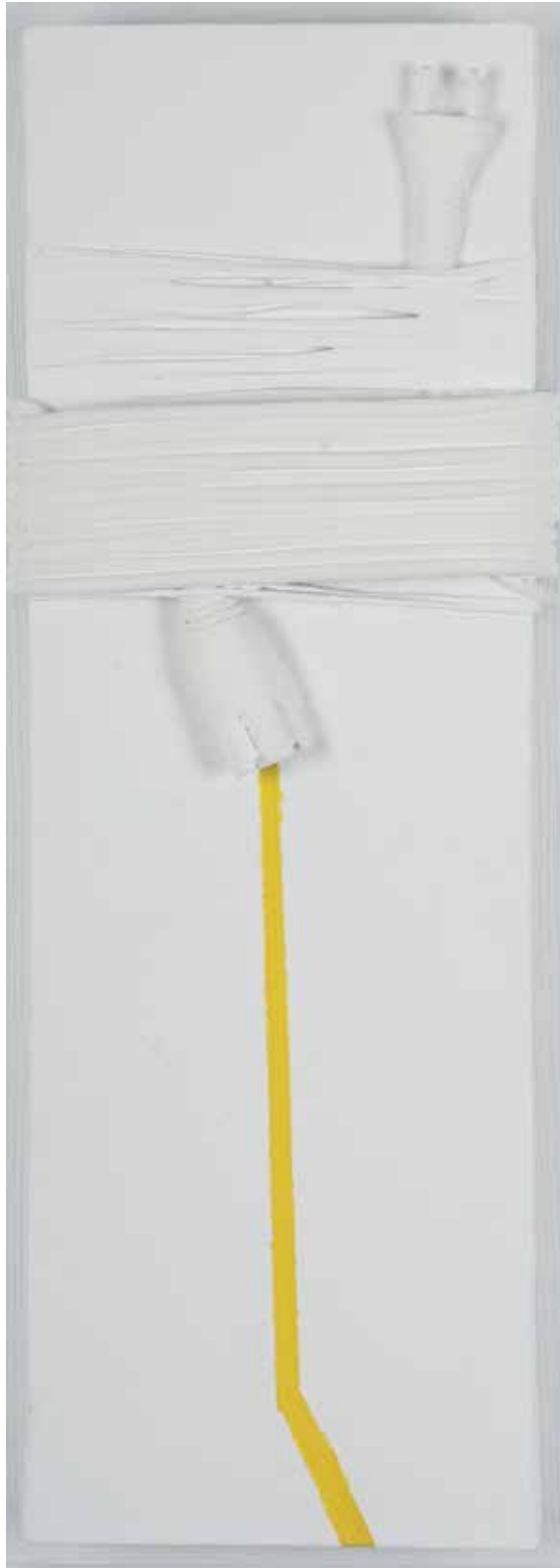
2009 - ILLIMITATO CONFINE - 8" x 23" (cm 20 x 60) - mixed media technique on canvas