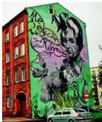
Przy ul. Górnośląskiej powstanie mural.

O wyborze finałowej trójki konkursu na mural zdecydowali internauci. Aż 773 z nich wzięło udział w internetowym głosowaniu na portalu Facebook, a sam profil Fryderyka w Warszawie w ciągu ostatniego tygodnia kon-